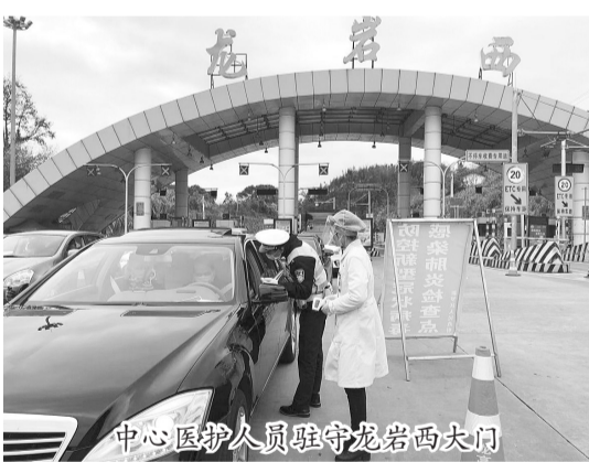
中心医护人员驻守龙岩西大门

同时,安全有序开展各项业务工作。2020年,在各科室的努力配合下,中心顺利完成各项年度考核指标,同时也完成14项国家基本公共卫生服务项目,在提质增效和任务完成率方面均得到上级主管部门的充分认可。