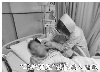
“耳穴埋豆”改善病人睡眠

熏蒸、艾灸、耳穴埋豆、刮痧……这些中医护理技术,在缓解和治疗褥疮、脊椎病、关节疼痛方面具有独到的优势。过去,这些