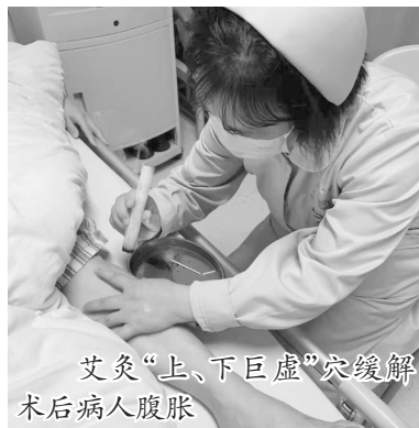
艾灸“上、下巨虚”穴缓解术后病人腹胀

熏蒸、艾灸、耳穴埋豆、刮痧……这些中医护理技术,在缓解和治疗褥疮、脊椎病、关节疼痛方面具有独到的优势。过去,这些