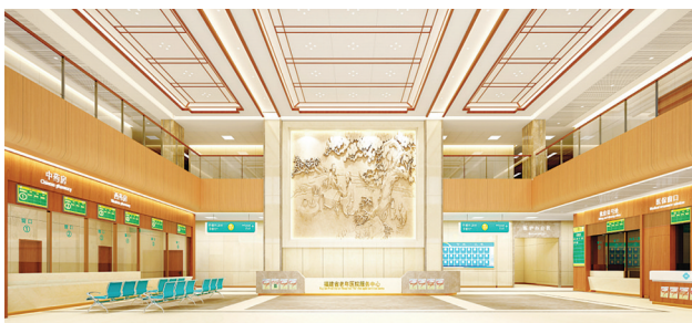
医院新门诊楼效果图

走进医院新门诊综合楼,一座崭新的、具有浓厚文化品位的花园式医院展现在眼前——宽阔明亮的门诊大厅内,随处可见的休息椅、无障碍设施、色彩鲜明的标志、