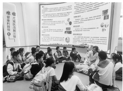
小学生在尤溪县总医院健康管理中心学习心肺复苏术

走进全民健康管理中心，尤溪县实验小学五年级二班的学生正在科普馆开展课外实践。学生们分成了三组，轮着跟随中心的宣教团队学习心肺复苏等急救技能、口腔卫生知识、营养膳食知识。