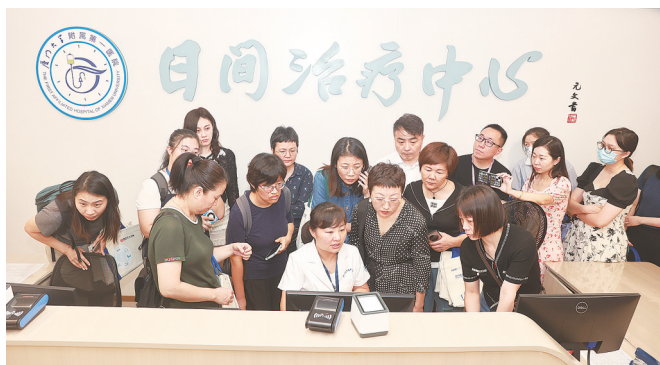
学员观摩厦大附一医院日间治疗中心

本次观摩会共有6名国内日间领域顶尖专家教授以及10名厦大附一医院在日间医疗工作中出色的管理者实践者,围绕日间医疗质量控制、风险防范、政策支持等热点问题授课并深入研讨,提出一系列具有前瞻性和指