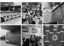
福州市·福建卫生职业技术学院 56分钟前

感谢@省卫校各位老师, @福州市人力资源和社会保障局, @海峡人才网 还有大老远赶回来的学生们 2022-2025年,年年来 每次都能让我收获满满 收起