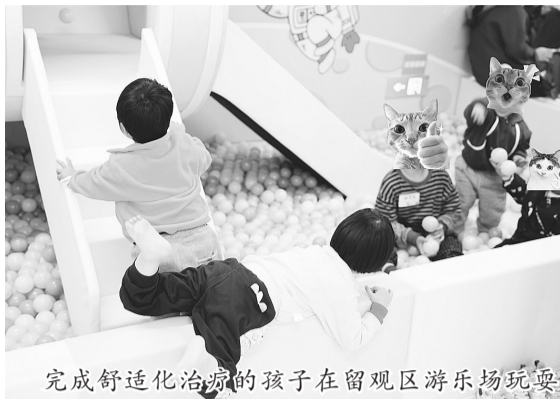
完成舒适化治疗的孩子在留观区游乐场玩耍

视网膜母细胞瘤是儿童最常见的眼部恶性肿瘤,定期眼底复查至关重要。年幼患儿往往因恐惧而极不配合,即使使用表面麻醉,仍会哭闹不止。若在强制下进行检查,不仅耗时更长,还可能影响