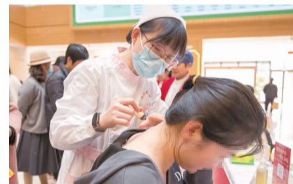
◀▲门诊大厅,市民沉浸式体验中医药文化

从地铁车站到院区现场,从义诊咨询到体验互动,这场贯穿城市通勤与民生服务的周年庆活动,让传统中医药悄然走进市民日常。