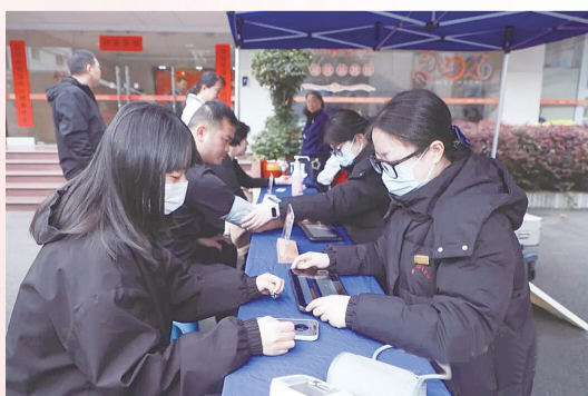
▲活动现场，工作人员为献血者进行献血前的初筛

华大街道社区卫生服务中心的医护人员专门现场提供了中医艾灸、刮痧，测量血压、血糖等免费义诊服务。