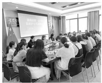
福州市第一总医院召开专题座谈会,院领导与护理代表围坐一堂、倾心畅谈,围绕日常工作、职业成长、后勤保障等方面,提出意见建议。