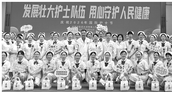
福建中医药大学附属人民医院举办了2026年国际护士节系列活动,表彰了优秀的护理团队与个人。