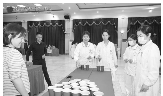
为缓解工作压力,关爱临床一线护理人员身心健康,泉州市第一医院护理部精心策划了“减压赋能,‘护’动未来”趣味游园会。