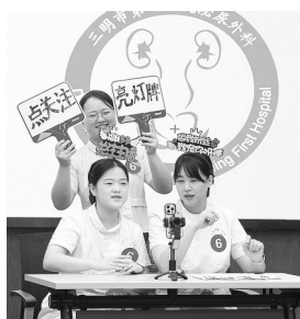
5月12日,三明市各医疗机构举办2026年国际护士节系列活动,图为三明市第一医院护理人员通过健康科普展演展现团队风采。