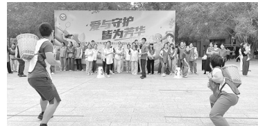
莆田市第一医院以“爱与守护,皆为芳华”为主题,在公园举办护士节趣味运动会。