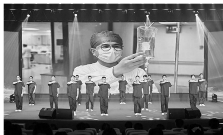
福州大学附属省立医院举行护士节表彰和庆祝活动。

2026年我国护士节的主题是“发展壮大护士队伍,用心守护人民健康”。我省各地积极开展活动,进一步激发护理人员职业荣誉感和神圣使命感,弘扬南丁格尔精神,展现护理工作风采。