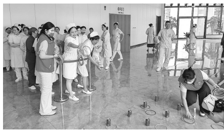
福建医科大学吴孟超纪念医院(孟超肝胆医院)护士节当天,组织趣味游园活动。