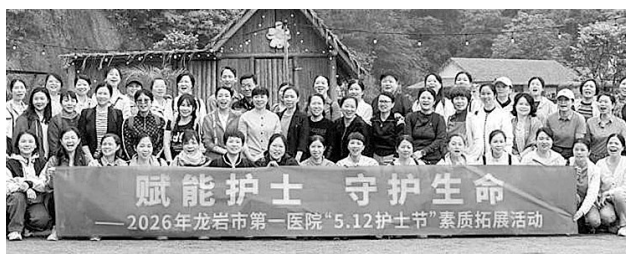
龙岩市第一医院组织“5·12护士节”素质拓展活动。