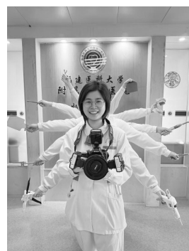
福建医科大学附属口腔医院以护士千手观音造型庆祝护士节——口腔护理人的“超能力”,就是样样都拿手。