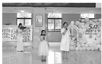
顺昌县总医院医生携手实验小学学生倾情演唱,南平市音乐家协会小提琴老师现场伴奏,赞歌致敬白衣天使。