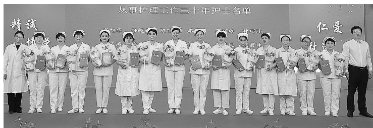
漳州市医院为30年护龄护理工作者、“星级”护士代表颁奖。