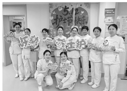
厦门大学附属第一医院为全院护士送上了节日的祝福与关怀,图为妇产科护士们在庆祝护士节。