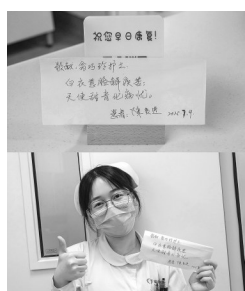
在福鼎市医院,医患间的感恩信,见证医护温度。