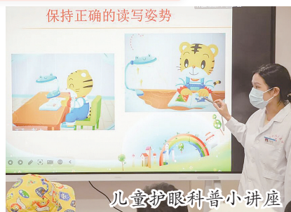
儿童护眼科普小讲座