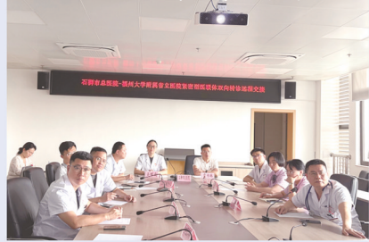
省立医院与石狮市总医院远程视频诊疗交接会