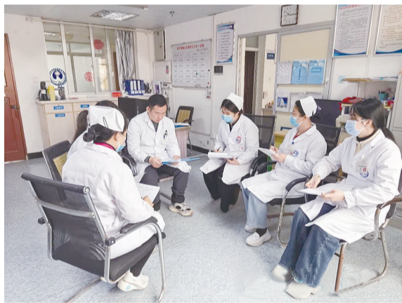
▲莆田学院附属医院医生在西天尾卫生院联合病房开展病例讨论工作

截至目前,全市已建成血透、消化内科、康复等特色联合病房18个,实现县区全覆盖。2025年全市联合病房共收治患者4243人次,患者医疗费用平均下降超30%。